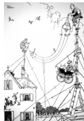
Umorul anilor 1930 valabil și astăzi