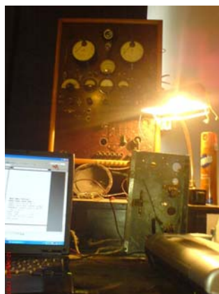
Contrastul dintre un stand de reparat și tehnica actuală