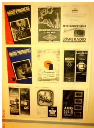
Afișele și reclamele vremii